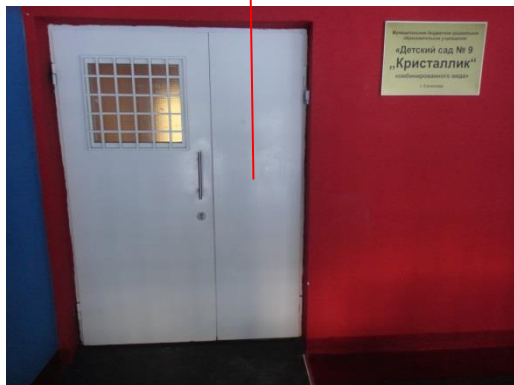
№ 9 Тамбур