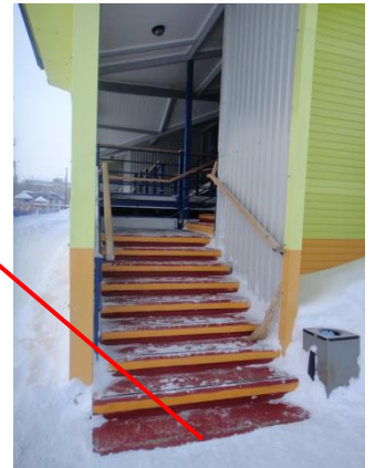
№ 6 Входная площадка