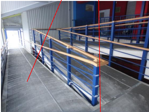
№ 7 Тамбур