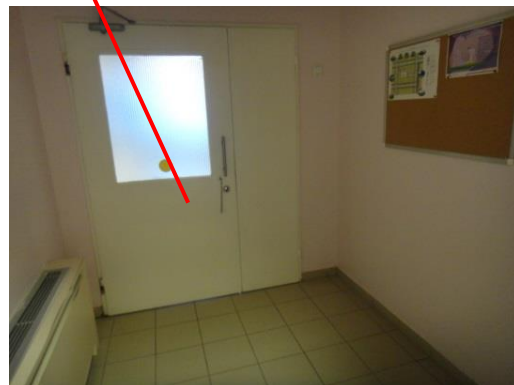
№ 10 Тамбур