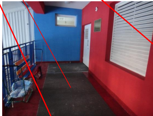
№ 8 Входная площадка